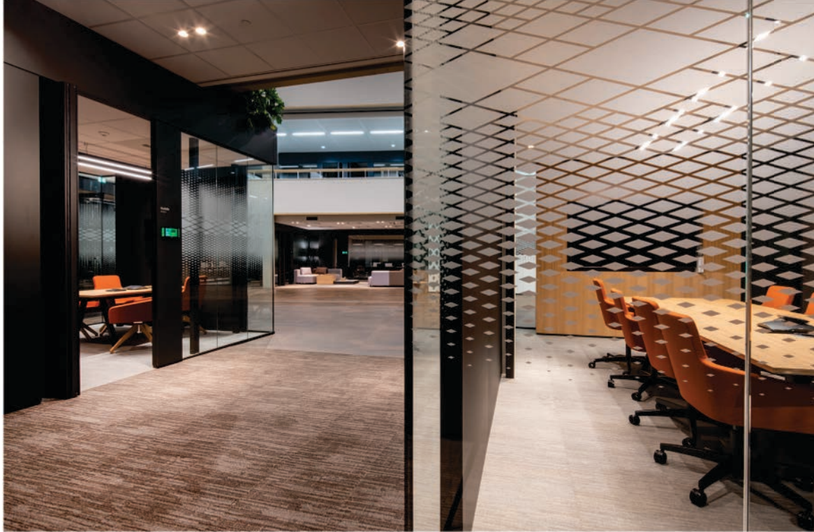
FOTO BOVEN Vergadercentrum op de begane grond.