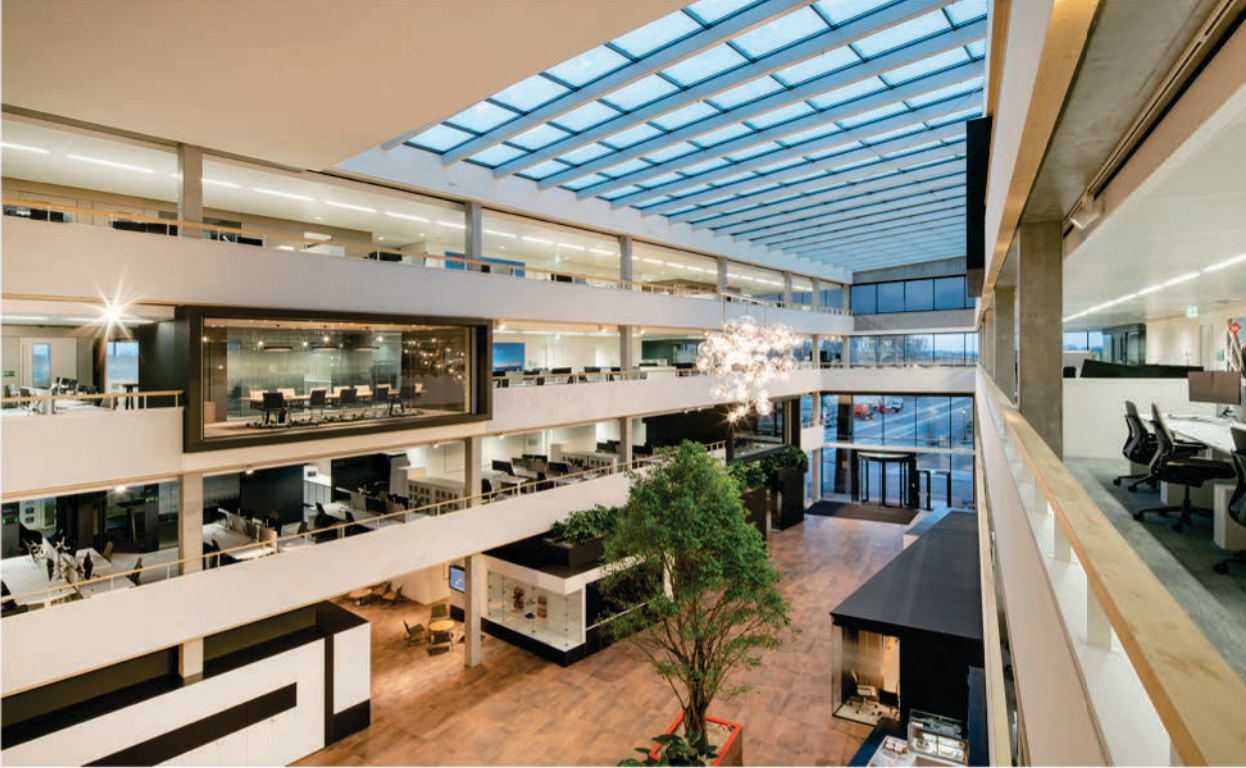
FOTO BOVEN Overzicht van het atrium.