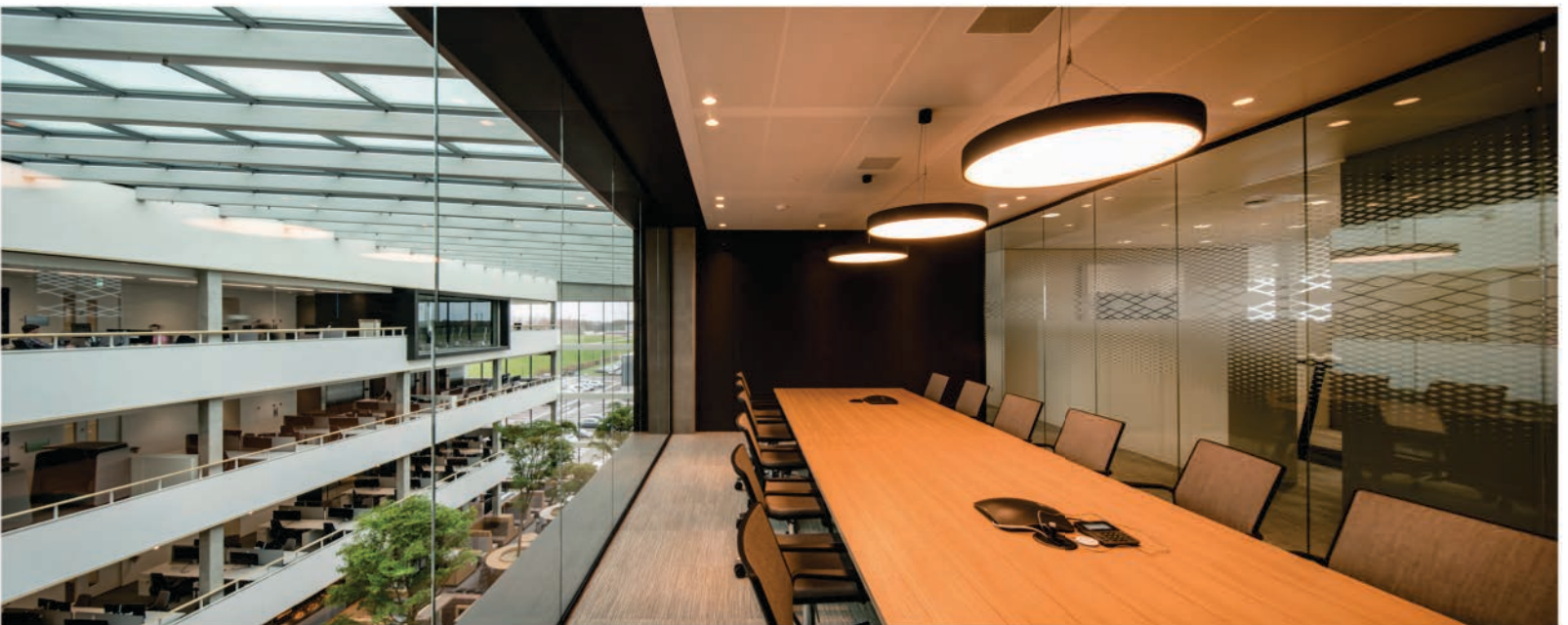
FOTO ONDER Vergaderruimte begane grond met ruimte voor informeel overleg.

zitjes, fauteuils en bijzettafeltjes. Deze variatie zorgt voor een goede doorloop. De bureaus in de open werkplekken zijn allemaal verstelbaar tot stahoogte.” Voor elke medewerker zijn er verdeeld door het gebouw trouwens twee stoelen beschikbaar. Een klein deel daarvan is terug te vinden in een van de specials die Group A ontwierp: overdekte zitjes in het restaurant, waar je bij een bespreking rustig en geconcentreerd kunt werken. Een ander opvallend interieurelement is de voor Dow Benelux ontworpen verlichting, waaronder de kenmerkende ‘molecuullamp’ in het atrium. Voor de overige ruimtes is een verlichtingsplan