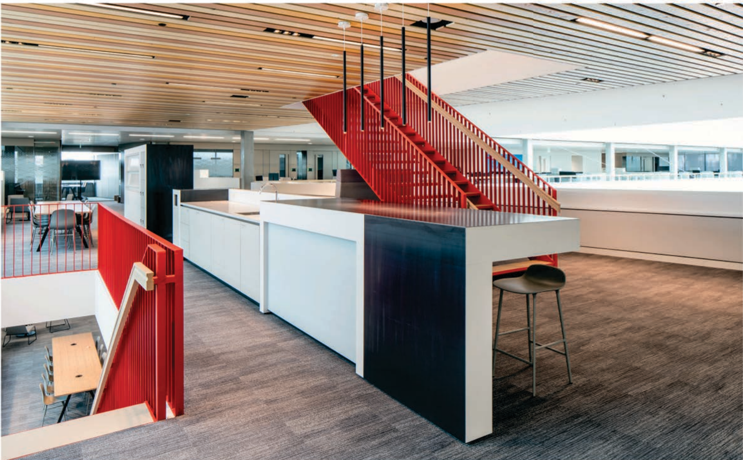
FOTO ONDER Centraal gelegen verbindingsbruggen in het atrium met de 'Dow-rode' trappen.

FOTO BOVEN Exterieur, met een op het landschap geïnspireerd kleurverloop.