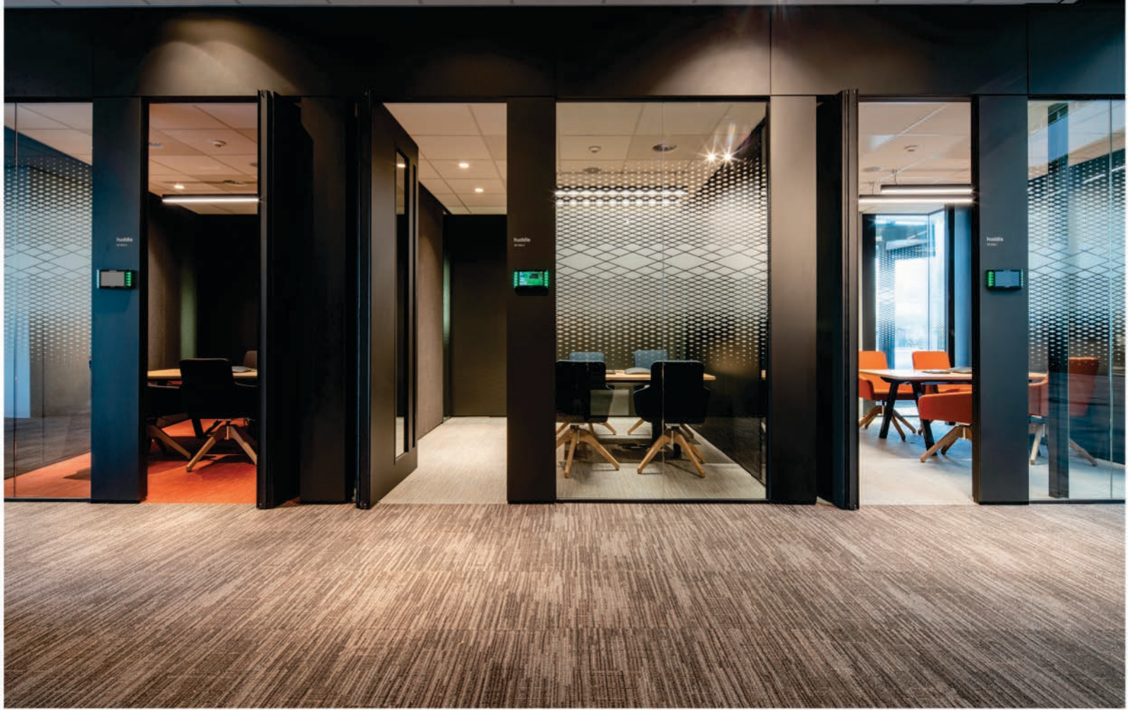
FOTO BOVEN Met de inrichting en verlichting zijn verschillende zones gecreëerd.